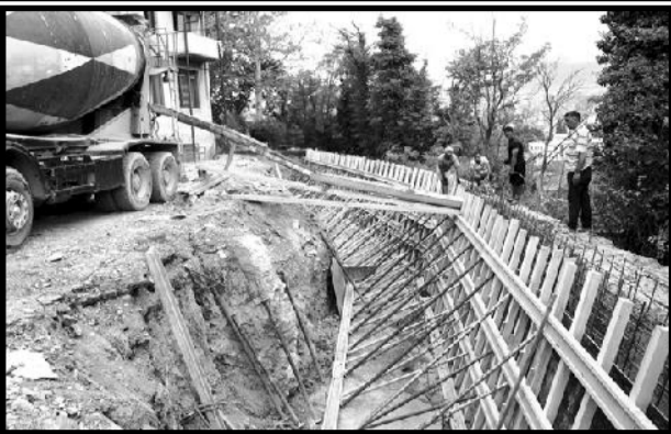
ქალაქ კასპში, კოსტავას ქუჩა №16-ში ეზოს დამცავი კედლის მოწყობის სამუშაოები მიმდინარეობს.