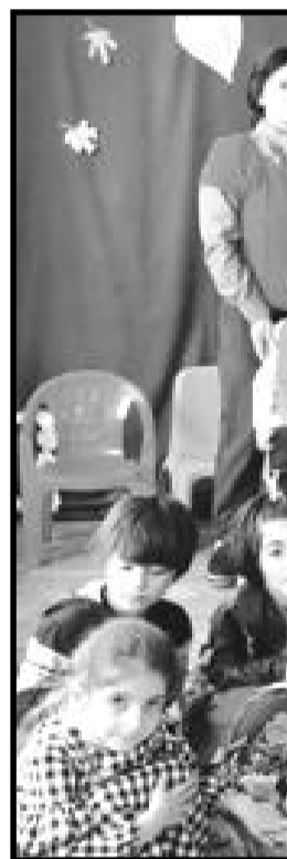
ბულ ყველა ღონისძიებაში.