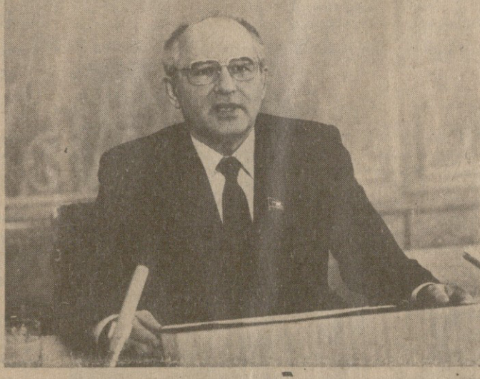
საქართველოს კომიტეტის ცენტრალური მდივანი მ. ს. გორბაჩოვი