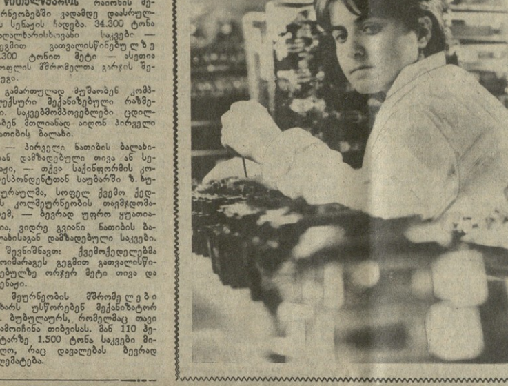
საქართველოს სსრ უმაღლესი საბჭოს და მინისტრთა საბჭოს ორგანო