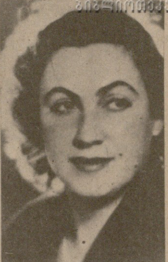
მართლმად მუსიკალური ხელოვნების...