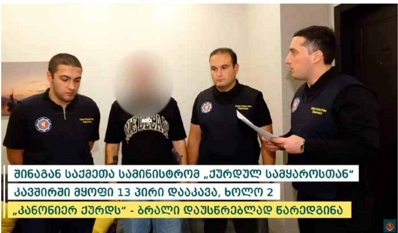
შინაგან საქმეთა სამინისტრომ „ქურდულ სამყაროსთან“ კავშირში მყოფი 13 პირი დააკავა, ხოლო 2 „კანონიერ ქურდს“ - ბრალი დაუსწრებლად წარედგინა

გამოძიება საქართველოს სისხლის სამართლის კოდექსის 223-ე პრიმა მუხლით, 223-ე მე-3 პრიმა მუხლით, 223-ე მე-4 პრიმა მუხლით და 236-ე მუხლის მეხამე ნაწილით მიმდინარეობს.