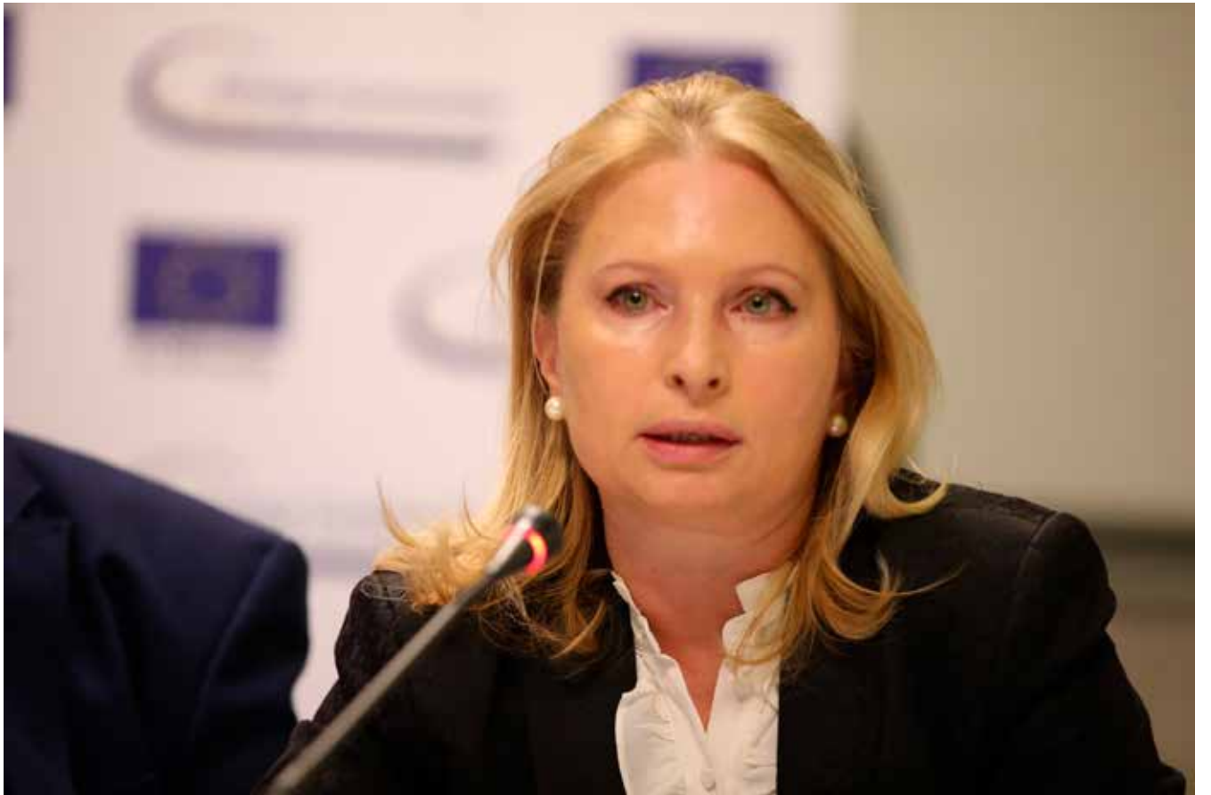
დგას თუ არა საქართველოს ფინანსური სექტორი რისკებში