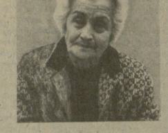
ბილაშვილი თინათინა თინათინის ასული... ბილაშვილი თინათინა თინათინის ასული...