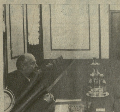
მ. ს. გორბაჩოვის მსახიობი მსახიობი...