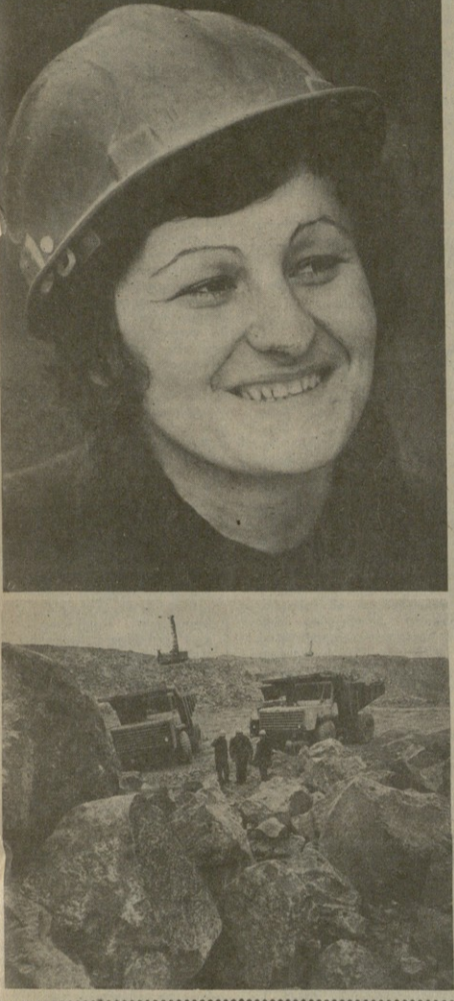
ხუთწლადი: დამამთავრებელი ფაქტი