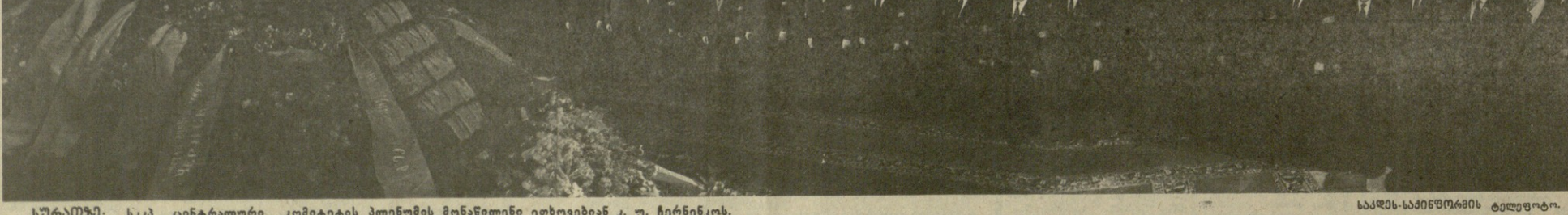
სსრკ ცენტრალური კომიტეტის პრეზიდიუმის მონაწილეები კ. უ. ჩარნაქოს დასაფლავების დასრულების შემდეგ...