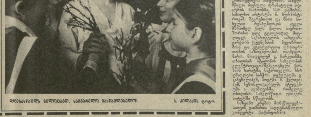
საბჭოთა ქალბავს განუყოფელი თანატოლი...