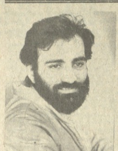
სახანაძე სტელტინის თაობაზე ინტერვიუ...