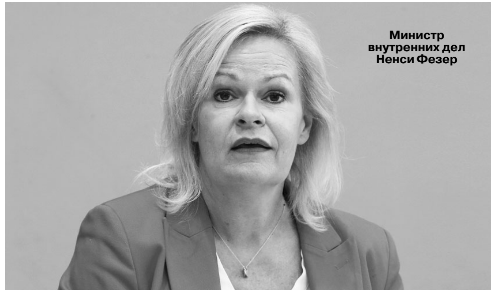
Министр внутренних дел Ненси Фезер

В стране принят ряд мер для того, чтобы не допустить нелегальной миграции в другие страны. В частности, власти уже сточили законодательство в отношении