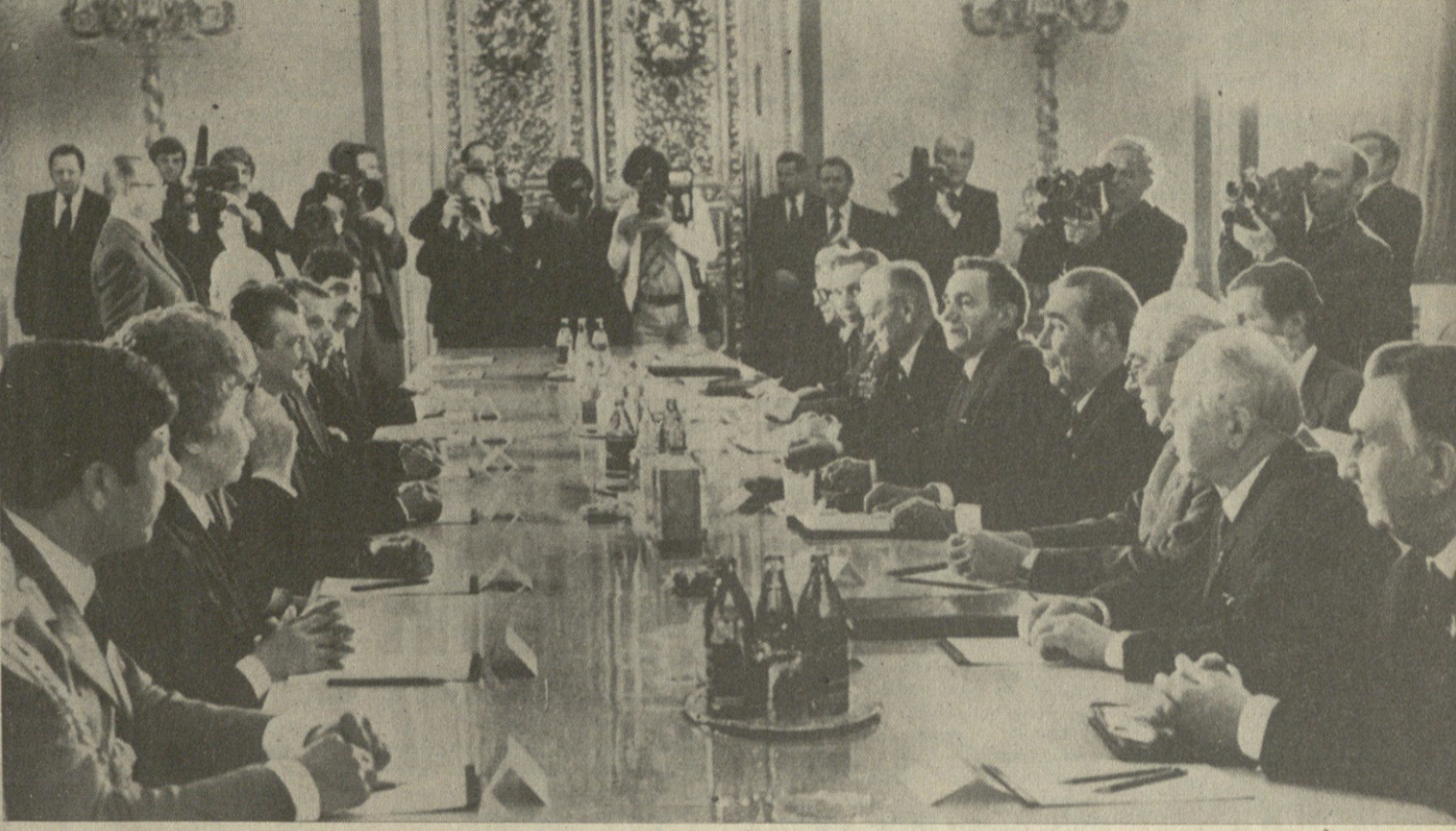
სურათში: მოლაპარაკების დროს. საბჭოთა კავშირის ტელეფონი.

16 თებერვლის კრებულში გაიმართა საბჭოთა კავშირ-აპლანეთის მოლაპარაკება. მოლაპარაკებამ მონაწილეობა მიიღო საბჭოთა კავშირის მხრიდან — სსკ ცენტრალური კომიტეტის მდივანი, სსრ კავშირის უმაღლესი საბჭოს პრეზიდიუმის თავმჯდომარე ლ. ბრეჟნევი, სსკ ცენტრალური კომიტეტის პოლიტბიუროს წევრი, სსრ კავშირის სახელმწიფო უშიშროების კომიტეტის თავმჯდომარე ი. ვ. ანდროპოვი, სსკ ცენტრალური კომიტეტის პოლიტბიუროს წევრი, სსრ კავშირის საგარეო საქმეთა მინისტრი ა. ა. გრომეკო, სსკ ცენტრალური კომიტეტის პოლიტბიუროს წევრი, სსრ კავშირის საგარეო ურთიერთობების კომიტეტის თავმჯდომარე ი. ვ. ანდროპოვი, სსკ ცენტრალური კომიტეტის პოლიტბიუროს წევრი, სსრ კავშირის საგარეო ურთიერთობების კომიტეტის თავმჯდომარე ი. ვ. ანდროპოვი.