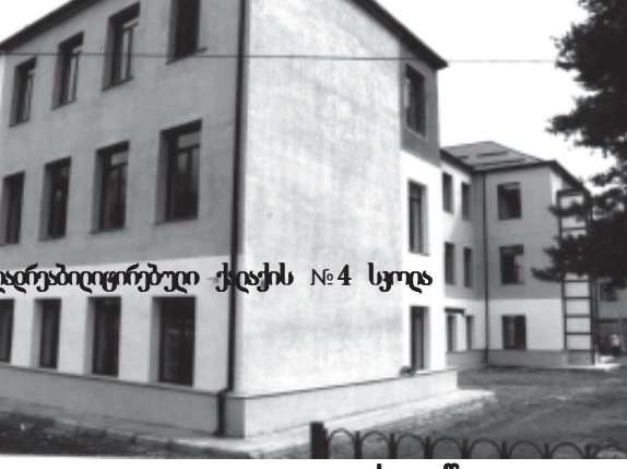
ახლადრეაბილიტირებული ქაჯის №4 სკოლა

ტადრისა და ახალდაბის სკოლებში, შეისწავლიან არსებულ მდგომარეობას და გაიტანენ საბჭოზე განსახილველად. ასევე მზადაა წალვერის საჯარო სკოლა, რომელიც ელოდება ავტორიზაციის საბჭოზე გასვლას. ავტორიზაცია ახალი გამოწვევაა სკოლებისათვის. შესა-