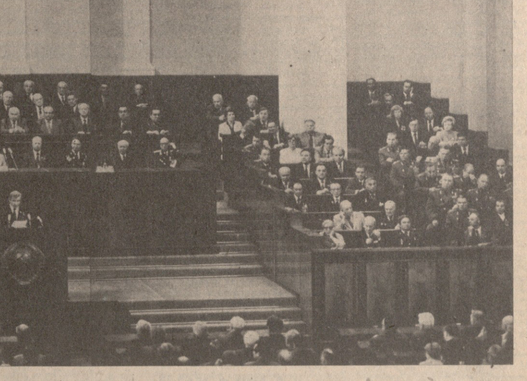
საპარტიო სხდომის დროს.

8350 ბაღათის კომუნისტური პარტიის პარტიული კომიტეტის მდიანი ი. კადარის მოხარებით და საბჭოთა ურთიერთობის შედეგები, რომელსაც საფუძვლად უდევს ღრმა ურთიერთობა, საბჭოთა ურთიერთობა, თანამედროვეობის უკმაპირი და საერთო შეხედულება სრულყოფილი ერთობაშია.