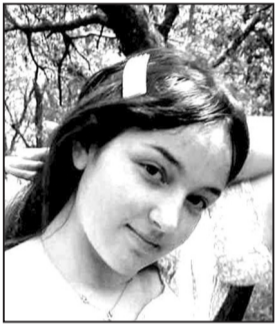
ანი მაისურაკი ოქროსმედალოსანი, ნაქალაქევი