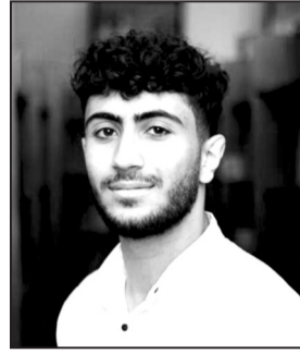
აიკ მაკარიან ოქროსმედალოსანი, დამალა