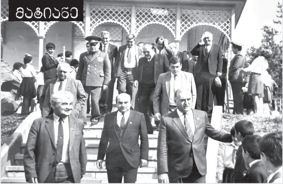
ასპინძა. რესპუბლიკის ხელმძღვანელები შოთა რუსთაველის სახელსმ რეზერვის გახსნაზე. 1987 წელი

ა(ა)პ ასპინძის მთავარი ბიბლიოთეკის საინფორმაციო ბიბლიოგრაფიული განყოფილება