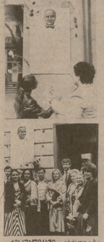
რესპუბლიკის გრემი... მისი მონაწილეობით... 1923-დან 1945 წლამდე ცხოვრობდა სსრკ-ში.

სახალბო არტისტი, ნიჭიერი მსახიობი და რეჟისორი მხილველი გელოვანი. ამ შესანიშნავი ოსტატის სახელთან დაკავშირებულია რუსეთის სახელობის თეატრის, მოსკოვის სახელმწიფო აკადემიური თეატრის შემოქმედებითი ცენტრების ბრწყინვალე ფურცლები. 1924-წლიდან მან ცხოვრობდა დაუკავშირებელი კინემატოგრაფის და შექმნა დაუწყვეტარი სახეები ფილმებში „სამი სიკეთეს“, „უკანასკნელი მასკარადი“, „ბაბა-რაბა“. მსაუბრეობის დასრულდა ფილმების მიმოხილვით — „ბერლინის დაგება“, „ოთხდღიანი კაცი“, „ლენინი 1918 წელს“, „ფიცი“ და მრავალი სხვა. მიზანმიმართულ მხილველს გელოვანის სახელთან გაიზიარა, განსაკუთრებით კინემატოგრაფიის კავშირის დაკავშირებით. პირველად მდინარე, რესპუბლიკის სახალბო არტისტები ე. შენგელია. სტენისა და გერანის გამოჩენილი ოსტატის შემოქმედებაზე ილაპარაკა თავის გამოსვლაში კინოფორუმზე 1945 წელს. დასწრებით მოგვინახა გულბარა საკრავის სახელობის თეატრის მოადგილე ა. ძიძიგურაძე. შეგვიხილეთ გელოვანი მადლობის სიტყვებით მიმართა მხილველს გელოვანის შვილი — გორბონიძის ოთხი წლის და ბაღდატის თეატრის მთავარი რეჟისორი, მისი დადებითი სსრკ-ში მისი მონაწილეობის შესახებ. მისი დადებითი მონაწილეობის შესახებ. მისი დადებითი მონაწილეობის შესახებ.