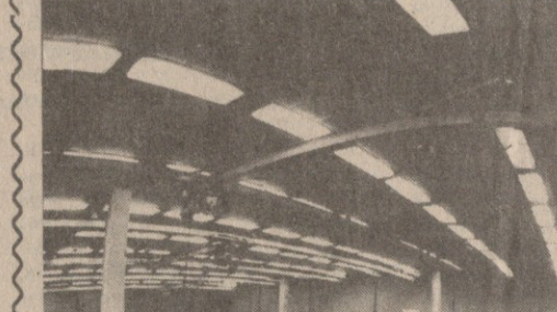
ფაქტორის უფროსი სამუშაო ფუთი, მინიმუმადე შედეგების მიღებას უზრუნველყოფს