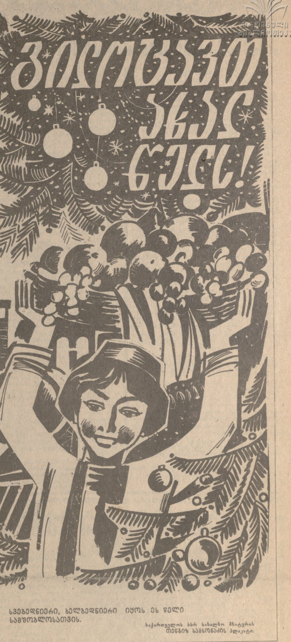
საგადაღები, ხალხაღები იყოს ეს წალი საგოვალსათვის.