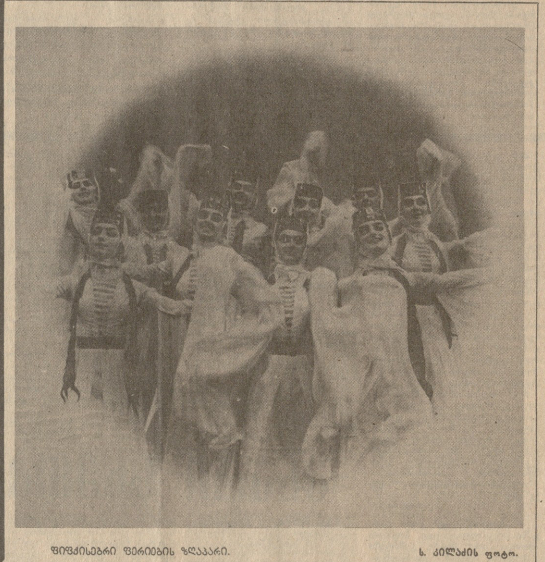
ფილიპინური მხარის ხალხი