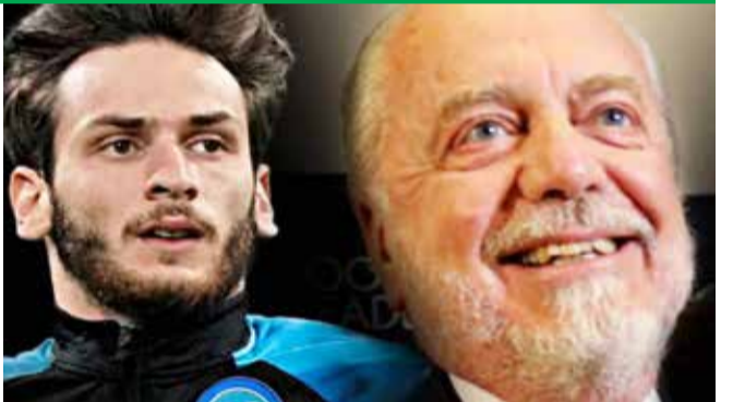
საერთოდ არ ვათამაშო. წესითა და რიგით, ყველაფერი სანაკრებო პაუზის დროს უნდა გაირკვეს ანუ მაშინ, როცა საკლუბო ფეხბურთი მიიძინებს და კლუბების ხელმძღვანელობაც მოცლით იქნება.