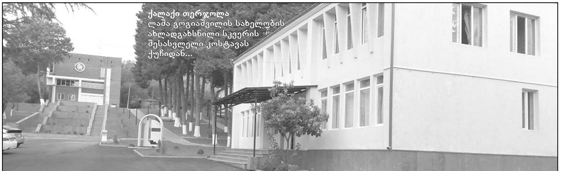
ქალაქი თერჯოლა ლაშა გოგიაშვილის სახელობის ახლადგახსნილი სკვერის შესასვლელი კოსტავას ქუჩიდან...