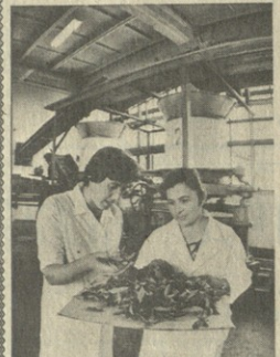
ჩანს ფოტოს წარჩინების მოქმედებასა და გადამამუშავების ხომალდებს შორის...