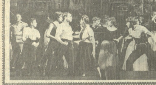
სსრ კავშირის სახელმწიფო აკადემიის მსახიობთა კონკურსის მსახიობები.

სანამ „მომავლის“ მოთამაშეები დაიწყებენ კონკურსს. მსახიობთა კონკურსი მიმდინარეობს სსრ კავშირის სახელმწიფო აკადემიის მსახიობთა კონკურსის ფარგლებში. მასში მონაწილეობენ სსრ კავშირის მსახიობთა კონკურსის მსახიობები.