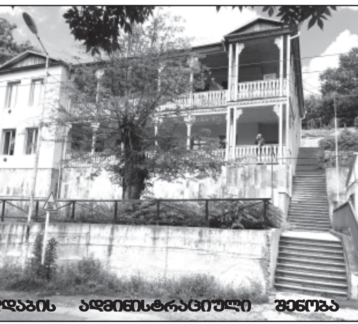
ახალდაბის ადმინისტრაციული შენობა

მაგალითად, ახალდაბაში კულტურისა და დასვენების პარკის მოსაწყობად საუკეთესო ადგილად მიგვაჩნია და სარკინიგზო გადასასვლელთან ყოფილი საავტოზო ფაბრიკის (საერთო ფართობით 28995 მ 2 ). ტერიტორია ამჟამად თავისუფალია შენობა-ნაგებობებისაგან და სამშენებლო ნარჩენებითაა მოვსილი. საკადასტრო გეგმით მდინარე მტკვრის გაყოფაზე ყველაზე გრძელი და დიდი ნაწილი ფართობით 18425 მ 2 დატოვებულია სახელმწიფოს საკუთრებაში, ხოლო მეორე ვიწრო და ასევე გრძელი ნაკვეთი ფართობით 9569 მ 2 საკუთრებაში სამშენებლო ფირმაზეა გადაცემული, ხოლო ორი ნაკვეთი ფართობებით 401 და 500 მ 2 ყოფილი ქარხნის ტერიტორიაზე შესასვლელი ქიშკარით ერთ ფიზიკურ პირზეა გადაცემული. აღნიშნულ ტერიტორიაზე კულტურისა და დასვენების პარკის განვითარება გეგმავს შედგენილი ვეცდებით ბორჯომის საკრებულოს შუამდგომ-