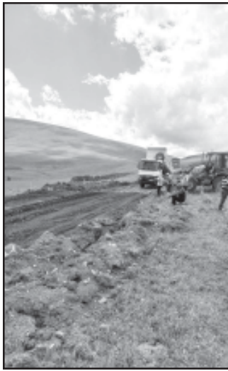
დაკვეთით შესრულდა, სადაც 10 ერთეული მძლავრი ტექნიკა მუშაობდა. სარემონტო სამუშაოები მთელ მონაკვეთზე ფაქტურად თავიდან მოეწყო ნიაღვრ-საგალი არხები, მოიხრეშა და საფუძველიანად მოიტკეპნა სამანქანო გზა.