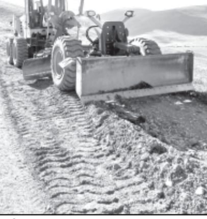
მა , გრეიდერისტი კონსტანტინე მეტრეველი , ტრაქტორისტი იოსებ გაგლოშვილ-