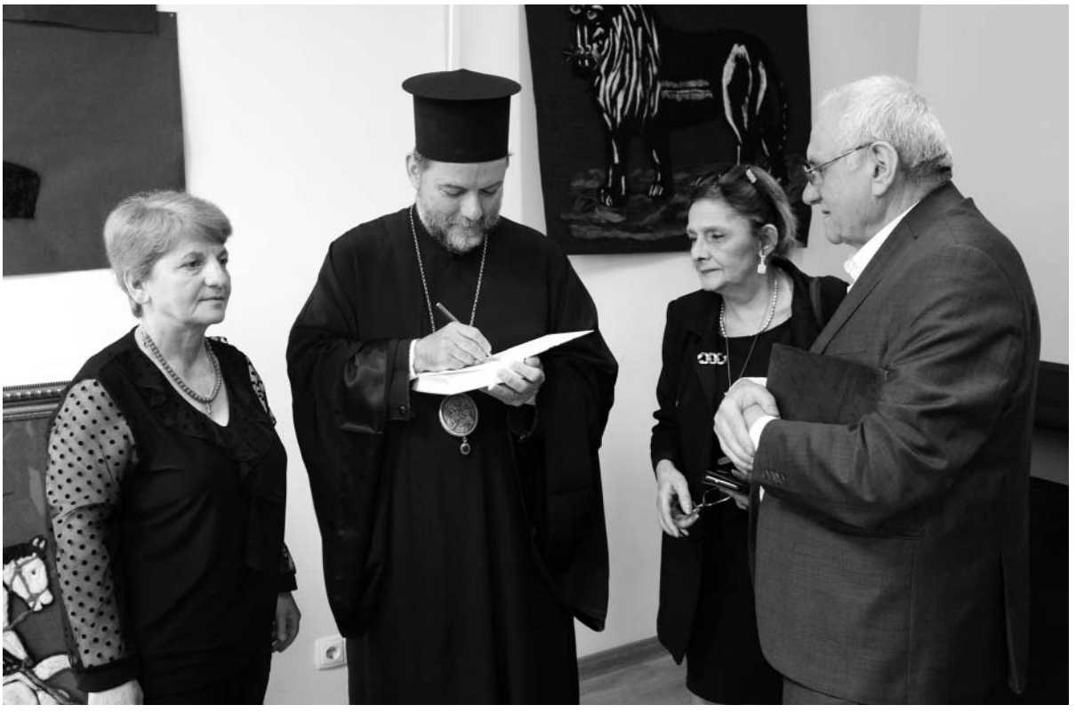
თუფალს თავის ხატად შეუქმნია თითოეული.