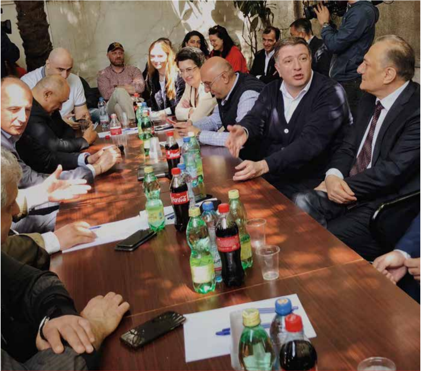
ვინ დაგვწყევლა ანუ ქვა, რომელიც აღმართში დაგვეწია

ამასთან, 2012 წლამდე შექმნილ, სააკაშვილის მო-