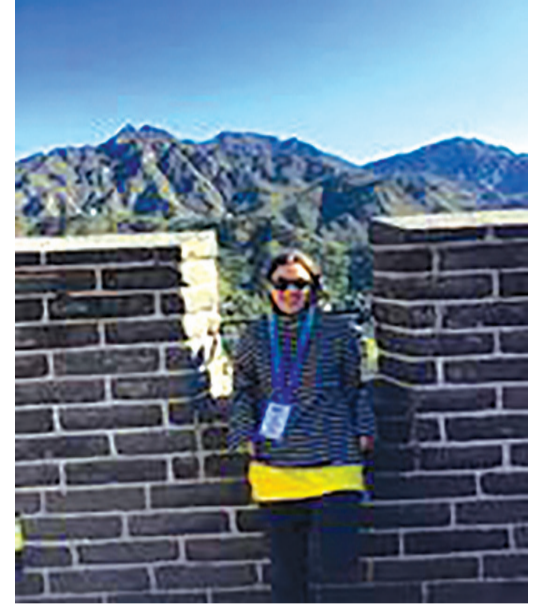
ჩინეთის დიდი კედელი

ჩემი ჰობია იოგა და თავისუფალ დროს იოგით ვარ დაკავებული, ასევე ძალიან მიყვარს ახალი ადგილების აღმოჩენა და ფოტოგრაფია. ამიტომ ხშირად დავდივარ უცნობ ქუჩებში და ვეძებ საინტერესო ადგილებს, ვიღებ უამრავ ფოტოს. ამ მხრივ აზია ძალიან საინტერესოა.