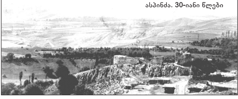
ასპინძა. 30-იანი წლები