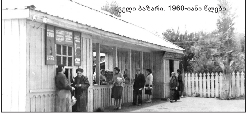
ძველი ბაზარი. 1960-იანი წლები

მებული ე.წ. ჰიგიენური აბანოს უკანა მხარეს ფუნქციონირებდა ძველი აბანო. არაუგვიანეს მე-19 საუკუნეს უნდა განეკუთვნებოდეს დღემდე შემორჩენილი კურორტ „ასპინძის“ ხიდის მარჯვნივ ძველი გოგირდოვანი აბანოს ნანგრევები, ახალი კი გაშენებული იქნა 60-იანი წლების დასაწყისში.