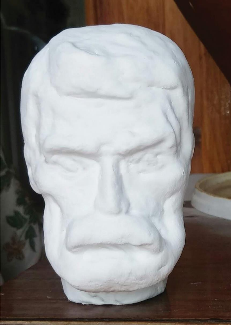
ვაჟა ფშაველა სკულპტურა: ლ.ბოცვაძისა 1988წ.