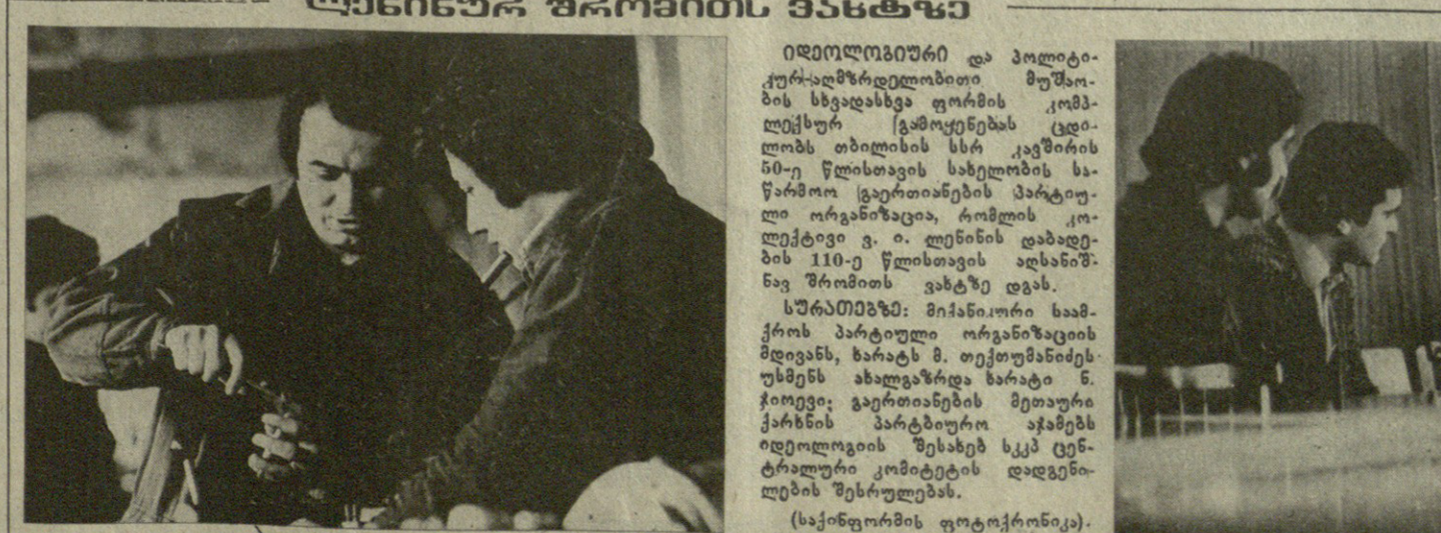
საბჭოთა დემოკრატიის ზეიმი... საბჭოთა დემოკრატიის ზეიმი...