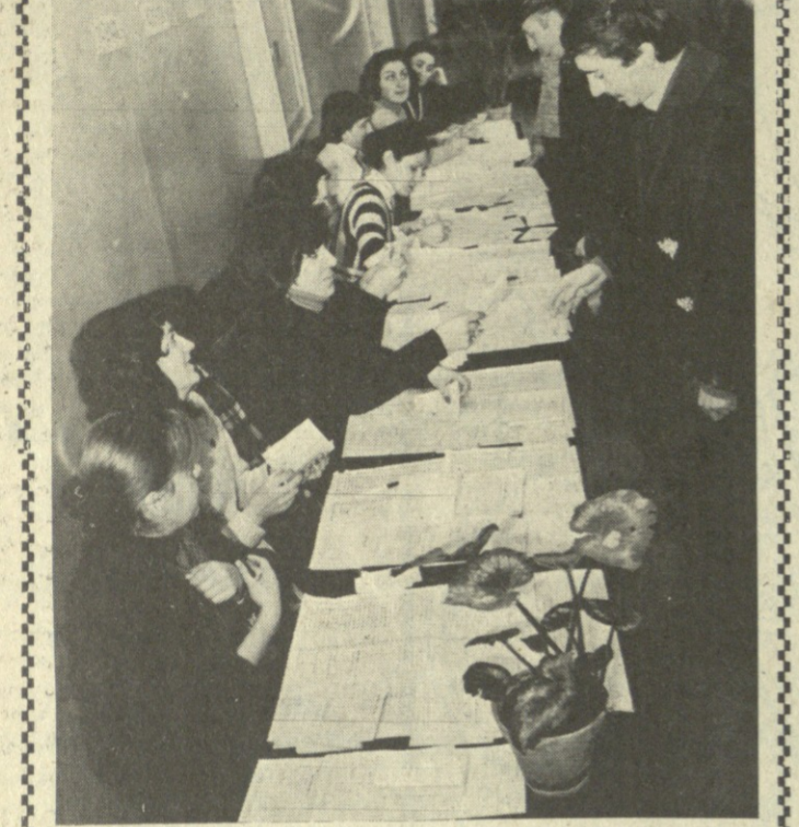
საერთაშორისო დიპლომატიის მინისტრის მოადგილე...