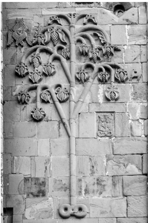
3. ანანური. ღვთისმშობლის მიძინების ტაძარი. XVII ს. დასავლეთის ფასადი – ვაზის, „სიცოცხლის ხის“ გამოსახულებით.

ქურუმი შესაძლოა, უწინარესად, ღვინით მაზიარებელი პიროვნება ყოფილიყო. მაშინ სვანური მარე, ქართული მარანი და მართვა/სამართალი რელიგიურ სიმბოლოთა ერთიან ჯაჭვში ლოგიკურად ექცევა. შემთხვევითი როდია, რომ სწორედ ვაზის სტილიზებული