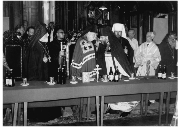
თბილისი. სიონის საკათედრო ტაძარი. საქართველოს ეკლესიის XI კრება. 1972 წ.