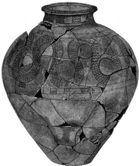
1. ქვევრის ტიპის ჭურჭელი. თრიალეთის კულტურა. ძვ.წ. XVIII-XVII ს.ს. ს. ჯანაშიას საქართველოს მუზეუმი.

ახლა ყურადღება მივაქციოთ იმ გარემოებას, რომ ქართული რწმენა-წარმოდგენების მიხედვით, ქაოსიდან კოსმოსის დაბადებას განასახიერებს გველზე შემჯდარი მზე, რომელიც ზესკნელ-ქვესკნელის წყალთა შორის მოძრაობის