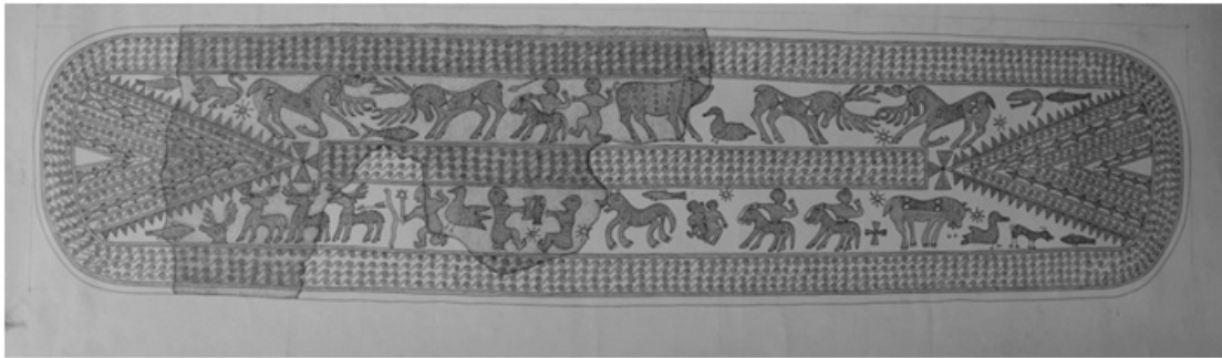
2. სარიტუალო ბრინჯაოს სარტყელი. სამთავროს სამაროვანი. ძვ.წ. VIII-VII ს.ს. ს. ჯანაშიას საქართველოს მუზეუმი.

არწივის მზიური ბუნება უნდა ვლინდებოდეს იმაშიც, რომ ეს ღვთაებრივი ნიშნების მქონე ფრინველი, ძველი სპარსული გადმოცემის მიხედვით, ვაზის კულტურის შემომტანადაც ითვლება. არსებობს მოსაზრება აღნიშნული თქმულება ძველურარტული სამყაროდან მომდინარეობდეს 35 . ნათქვამის გათვალისწინებით, მარანში ჩაბუდებული „მარ“ მარცვალი, ბუნებრივია, ამოვიკითხოთ ასევე სიტყვაში – მართვე, რომელიც უწინარესად, სწორედ არწივის ბარტყს აღნიშნავს. შესაძლოა, ამავე ფუძიდან მომდინარეობდეს ისეთი სიტყვები, როგორიცაა, „მართვა“ და „სამართალი“ 36 , ვინაიდან თუკი საკითხს ღვთაებრივი კუთხიდან