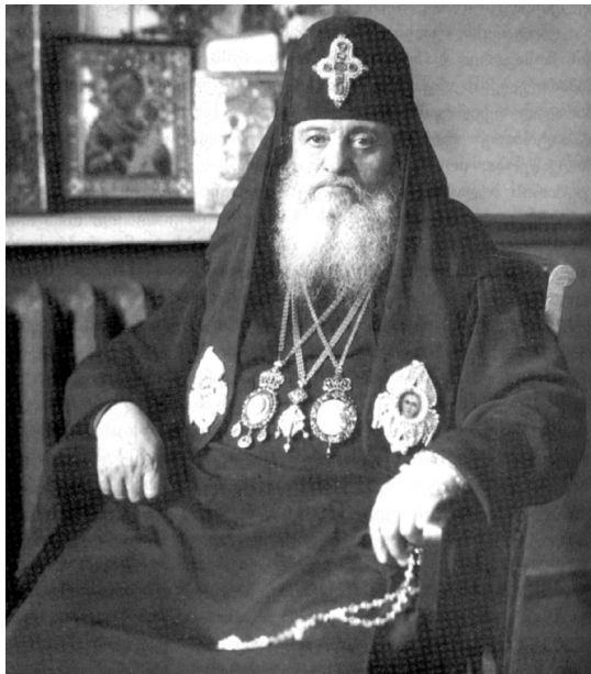
სრულიად საქართველოს კათოლიკოს-პატრიარქი ეფრემ II (1960-1972 წ.წ.)