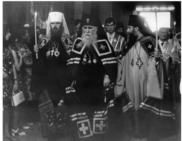
თბილისი. სიონის საკათედრო ტაძარი.