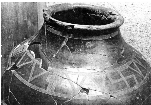
6. ქვევრი ორნამენტიზირებული ყელით. წალკა. ძვ.წ. მეორე ათასწლეულის მეორე ნახევარი. ს. ჯანაშიას საქართველოს მუზეუმი.

76 ნიშანდობლივია, რომ გრ. რობაქიძე წმინდა ნინოს ჯვარს პირდაპირ მაზიარებელი ჯვრის დატვირთვას აძლევს: „უბედურების ჟამს ვაზის ლერწისგან გამოჭრილ ჯვარს, რომელიც წმინდა ნინომ თავისი თმებით შეკრა, მტევნები გამოუღია, მისი წვენი რაინდებს თასით შეუნახავთ. ეს თასი „გრაალია“, გული საქართველოსი.. ვერ მონახავთ ამ ქვეყნად მეორე სახელმწიფოს,