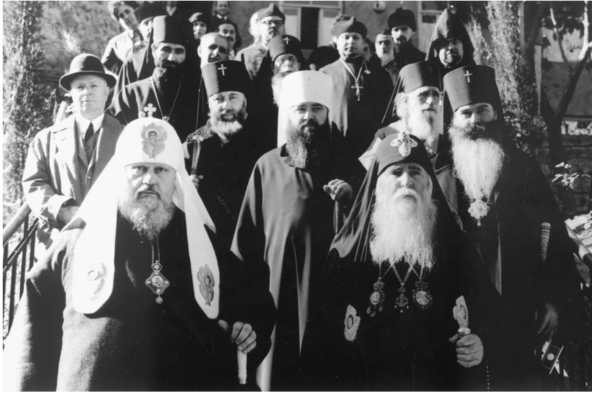
სრულიად საქართველოს კათოლიკოს-პატრიარქი დავით V, მოსკოვისა და სრულიად რუსეთის პატრიარქი უწმიდესი პიმენი და მიტროპოლიტი ილია მცხეთის სამთავროს დედათა მონასტერში. 1972 წ.