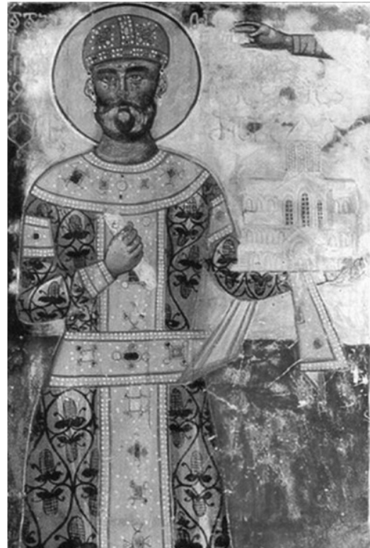
4. გელათის მონასტერი. ღვთისმშობლის შობის სახელობის ტაძარი. წმინდა დავით აღმაშენებლის საქტიტორო გამოსახულება. XVI ს.

ვინაიდან „აღვად ამოსული“ ვაზი ღვთის კარზე მდგარი „სიცოცხლის ხეა“ (ფოტო №3), რომელიც უხილავად აკავშირებს ცასა და მიწას 38 და რომლის წვენიც განღმრთობისა და უკვდავების საწინდარია (მისი უჭმელი ქალ-ვაჟი უდროოდ დაშაულაო), ჯერ კიდევ ქრისტესშობამდე, განღმრთობილი მეფე-