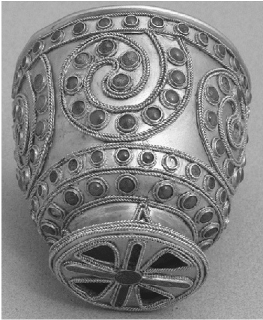
8. თრიალეთის ოქროს თასი. ძვ.წ. მეორე ათასწლეული. ს. ჯანაშიას საქართველოს მუზეუმი.

მომდინარე ოთხი მდინარის სამოთხისეულ ხატებას გვახსენებს და მიგვანიშნებს, რომ ქორწილი თავისი არსით საკრალურია და მან წყვილი სამარადისოდ ღმერთში უნდა გააერთიანოს. ჯვრისწერის რიტუალის მარანში გამართვის ტრადიცია 80 გამოწვეული უნდა ყოფილიყო უწინარესად იმით, რომ ეს საღვინე სახლი სამოთხის მიწიერი ხატებაა, სადაც ხილულად (იგულისხმება დედაბოძი) თუ უხილავად „სიცოცხლის ხე“ მყოფობს და მისი მაცხონებელი წვენიც იქ მოედინება.