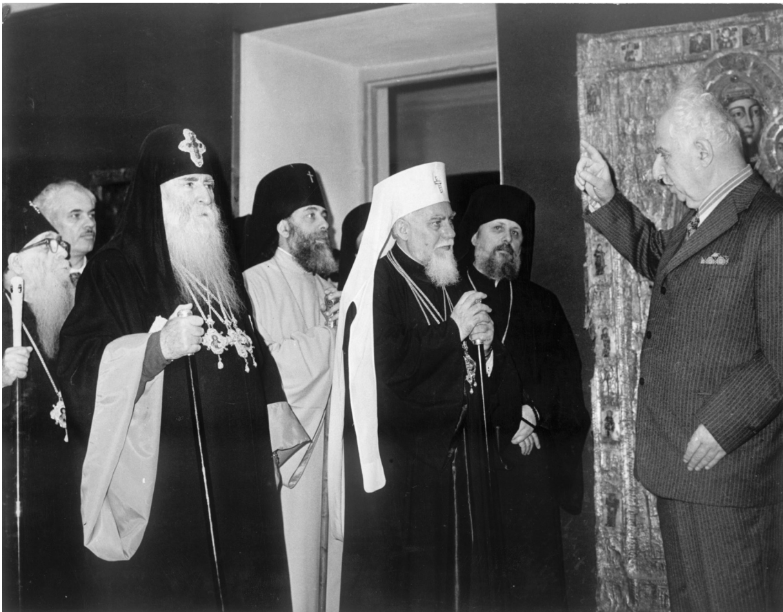
სრულიად საქართველოს კათოლიკოს-პატრიარქი დავით V და მიტროპოლიტი ილია მასპინძლობენ ბულგარეთის პატრიარქს, უწმიდეს მაქსიმეს. 1976 წ.