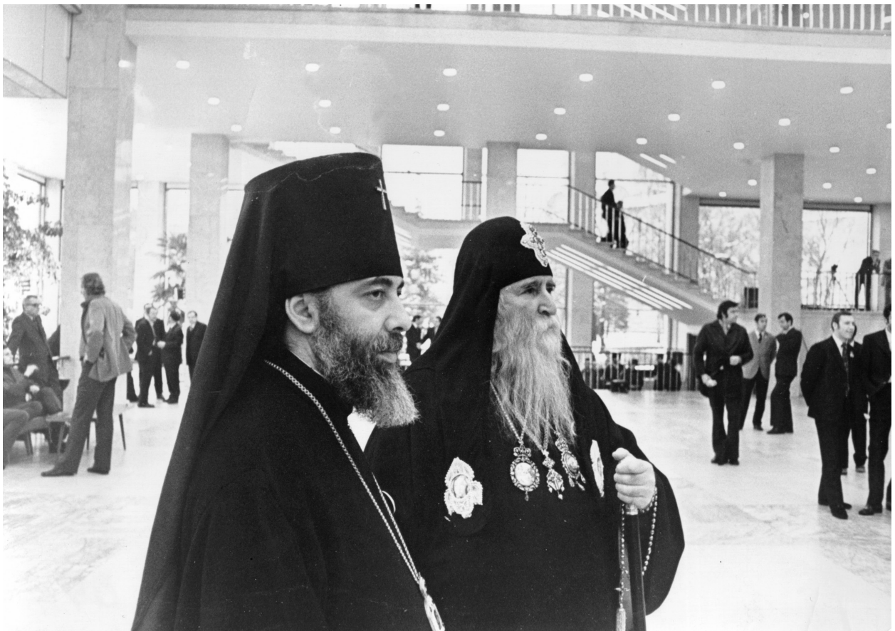
სრულიად საქართველოს კათოლიკოს-პატრიარქი დავით V და მომავალი პატრიარქი ცხუმ-აფხაზეთის მიტროპოლიტი ილია. 1976 წ.