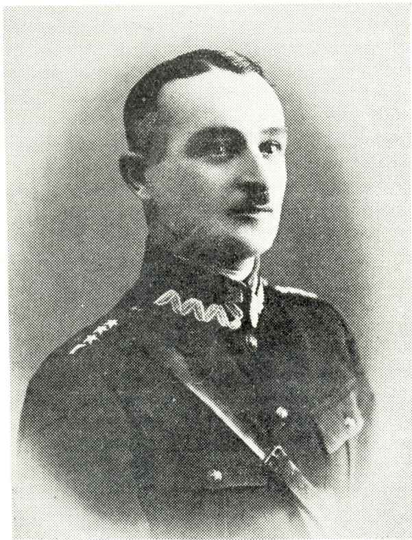
† კაპიტანი დავით მაჭავარიანი

არ გვაინტერესებს არავისი ბრალდება, გამართლება და საერთოდ, გასამართლება. ეს მხოლოდ მომავალი ისტორიის როლია. გვსურს მხოლოდ გადავცეთ ისტორიას უცვლელი ფაქტები უშუალო წყაროდან; ამიტომ ვთხოვთ ყოველ ქართველს, მისი პირადი შეხედულების განურჩევლად, გადმოგვცეს თავისი მოგონებანი იმ სახით, როგორაც ავტორი ხედავდა ფაქტებს სახელმწიფოებრივი იერარქიის იმ საფეხურიდან, რომელიც მას ეკავა ჩვენი ერის ცხოვრებაში.