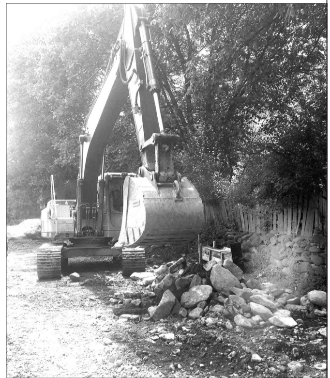
სამუშაოებს ტენდერში გამარჯვებული კომპანია შპს „არალი“ აწარმოებს და პროექტის სახელმწიფო ღირებულება 982 999 ლარს შეადგენს. პროექტი გარდამავალია და განსაზღვრულ ვადებში დასრულდება.

როგორც ჩვენი გაზეთის მკითხველებმა იციან, გასული საუკუნის 70-იანი წლების მიწურულს იმუშაინდელი ხელი-სუფლების გადაწყვეტილებით ასპინძის რაიონში ინტენსიურად დაიწყო მალაქითიანი აჭარის რეგიონებიდან (ძირითადად ხულოს რაიონიდან) მოსახლეობის გეგმიური წესით ჩამოსახლება, რომელთაგან ნაწილი სოფელ ოშორაში ჩაასახლეს, ე.წ. სოფლის ქვედა უბანში. იმის მიუხედავად, რომ სახელმწიფომ ახალმოსახლეებს დიდი დახმარება გაუწია საცხოვრებელი სახლების მშენებლობის საქმეში, სამწუხაროდ, ბევრი არაფერი გაკეთებულა სოფლის ინფრასტრუქტურის გაუმჯობესებისათვის, მოუწესრიგებელი შიდა გზები დიდ პრობლემებს უქმნიდა ახალმოსახლეებს და უამინდობის დროს შეუძლებელი იყო გადაადგილება. დროთა განმავლობაში, კერძოდ, უკანასკნელ ათწლეულში ბევრი სასიკეთო ცვლილებები მოხდა ადგილობრივი მოსახლეობის სასარგებლოდ. პირველ რიგში მოწესრიგდა სოფლის შიდა გზები, მოიხსნა განათების და სასმელი წყლის პრობლემა, ახლახან კი დაიწყო მეტად მნიშვნელოვანი პროექტის განხორციელება, რაც ითვალისწინებს სოფლის ზედა უბნისა და ქვედა უბნის უმოკლესი დამაკავშირებელი შიდა გზის რეკონსტრუქციას, რაც ძირითადად ითვალისწინებს მდინარე ოშორულას გასწვრივ გზის დიდი მონაკვეთის კეთილმოწყობას თანამედროვე სტანდარტების დონეზე. პროექტის ფარგლებში მოეწყობა ასფალტობეტონის საფარი, გზის საყრდენი კედელი და სხვა საგზაო ინფრასტრუქტურა. საგულისხმოა ისიც, რომ ამ პროექტის განხორციელებისათვის მნიშვნელოვანი ძალისხმევა გამოიჩინა მუნიციპალიტეტის მერიამ და ამ სოფლის მოსახლეობისათვის დიდი საშვილიშვილო საქმის განხორციელება გადამწყვეტია, რაც დიდ ფინანსებთან არის დაკავშირებული.