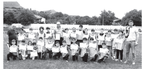
რაციის მთავარ მიზანს წარმოადგენს ამ კამპანიისთვის გლობალური ხასიათის მიცემა, მოსწავლეებისათვის მეტი ჩართულობისკენ მოწოდება და ნახალისება.

„მოდი ვიმოდროთ“ - Let's Move - გლობალური კამპანიის, ასპინძის მუნიციპალიტეტიც შეუერთდა. 23 ივნისს, საერთაშორისო ოლიმპიური კომიტეტისა და სასკოლო სპორტის საერთაშორისო ფედერაციის ორგანიზებით ოლიმპიზმის საერთაშორისო დღესთან დაკავშირებით კამპანია სახელწოდებით - „მოდი ვიმოდროთ“ (Let's Move) გაიმართა. ასპინძის მუნიციპალიტეტი აღნიშნულ კამპანიას სხვადასხვა სპორტული აქტივობით შეუერთდა, სადაც აქაი ასპინძის სასპორტო გაერთიანებამ მოზარდი სპორტსმენები სიგელებით დააჯილდოვა. საერთაშორისო ოლიმპიური კომიტეტისა და სასკოლო სპორტის საერთაშორისო ფედერაციის მთავარ მიზანს წარმოადგენს ამ კამპანიისთვის გლობალური ხასიათის მიცემა, მოსწავლეებისათვის მეტი ჩართულობისკენ მოწოდება და ნახალისება. აღნიშნული კამპანიის მიზანია მოსწავლეების ჯანსაღი ცხოვრების წესის დანერგვა.