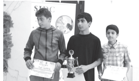
ბატები უკეთესი განვითარებისთვის“, მიზანია „ასპინძის მუნიციპალიტეტში მცხოვრები ახალგაზრდების ჩართვა შემეცნებით/გასართობ აქტივობებში“. „დებატები უკეთესი განვითარებისთვის“ იმართება ასპინძის მუნიციპალიტეტის მერიასთან თანამშრომლობით და მათი მხარდაჭერით. „SKYE HUB“-ის პროექტი განხორციელდა სამცხე-ჯავახეთის განვითარების ცენტრის „ხარისხიანი სოციალური მომსახურებები - ყველაზე მოწყვლადი ჯგუფების უკეთესი წვდომა“ - პროექტის ფარგლებში, „World Vision“-საქართველოს ფინანსური და ტექნიკური მხარდაჭერით.

26 ივნისს ასპინძის კულტურის ცენტრში გაიმართა პროექტის - „დებატები უკეთესი განვითარებისთვის“ - ფარგლებში დებატების ნახევარფინალი და ფინალი. ნახევარფინალში ერთმანეთს დაუპირისპირდა რუსთავისა და ოზორის, დამალისა და ტოლოშის საჯარო სკოლები. დებატების ფინალში ერთმანეთს დაუპირისპირდა რუსთავისა და ტოლოშის საჯარო სკოლები და გამარჯვება რუსთავის საჯარო სკოლამ მოიპოვა. „დებატები უკეთესი განვითარებისთვის“ პროექტის ფარგლებში მონაწილეობას იღებდა ასპინძის მუნიციპალიტეტის 8 საჯარო სკოლის მოსწავლეები, მათ შორის: ასპინძის, რუსთავის, ოზორის, ივერიის, აწყვეტის, ტოლოშის, ნაქალაქევის, დამალის საჯარო სკოლები. პროექტი მოიცავდა სამ დღეს: I დღეს ასპინძის კულტურის ცენტრში ჩატარდა საინფორმაციო შეხვედრა - „რა არის დებატები და როგორ წარვმართოთ იგი“;