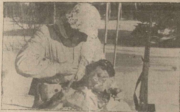
A scene from the New Soviet Film "In The Rear of the Enemy" now appearing at the Stanley Theatre located on the corner of 42nd St. and Seventh Ave.

The entrance fee to this worthy affair is 75¢ in advance and $1 at the door.