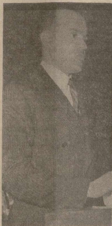
Генеральный консул СССР в Нью Йорке ВИКТОР ФЕДУШИН