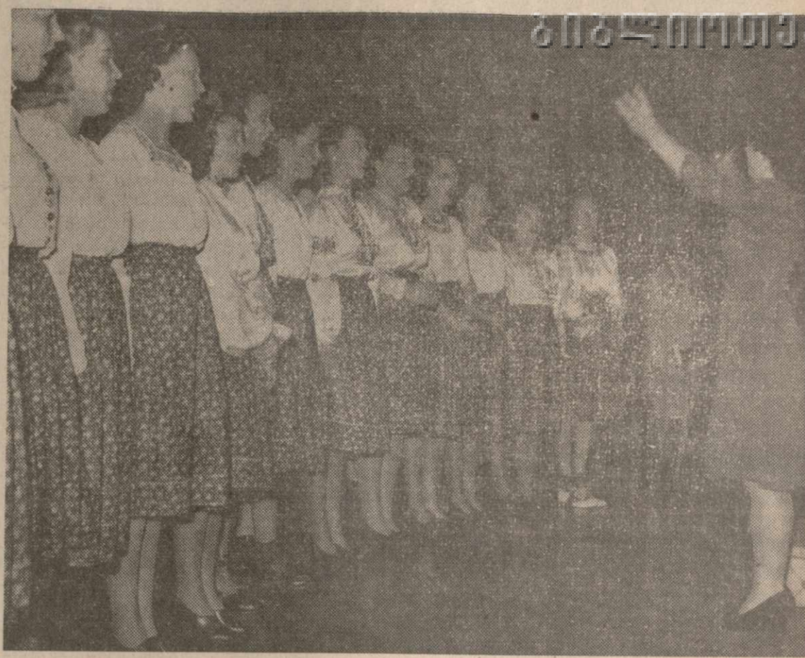
Хор общества им. Радищева исполнил государственные гимны США и СССР и ряд советских песен.