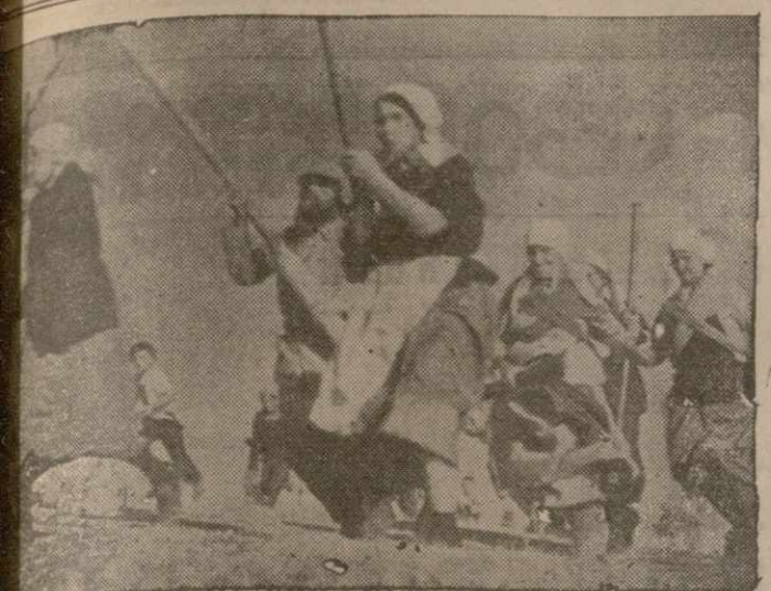
Фильм «Партизанские отряды» демонстрируется в театре «Пэнн Сикер» в Кливленде