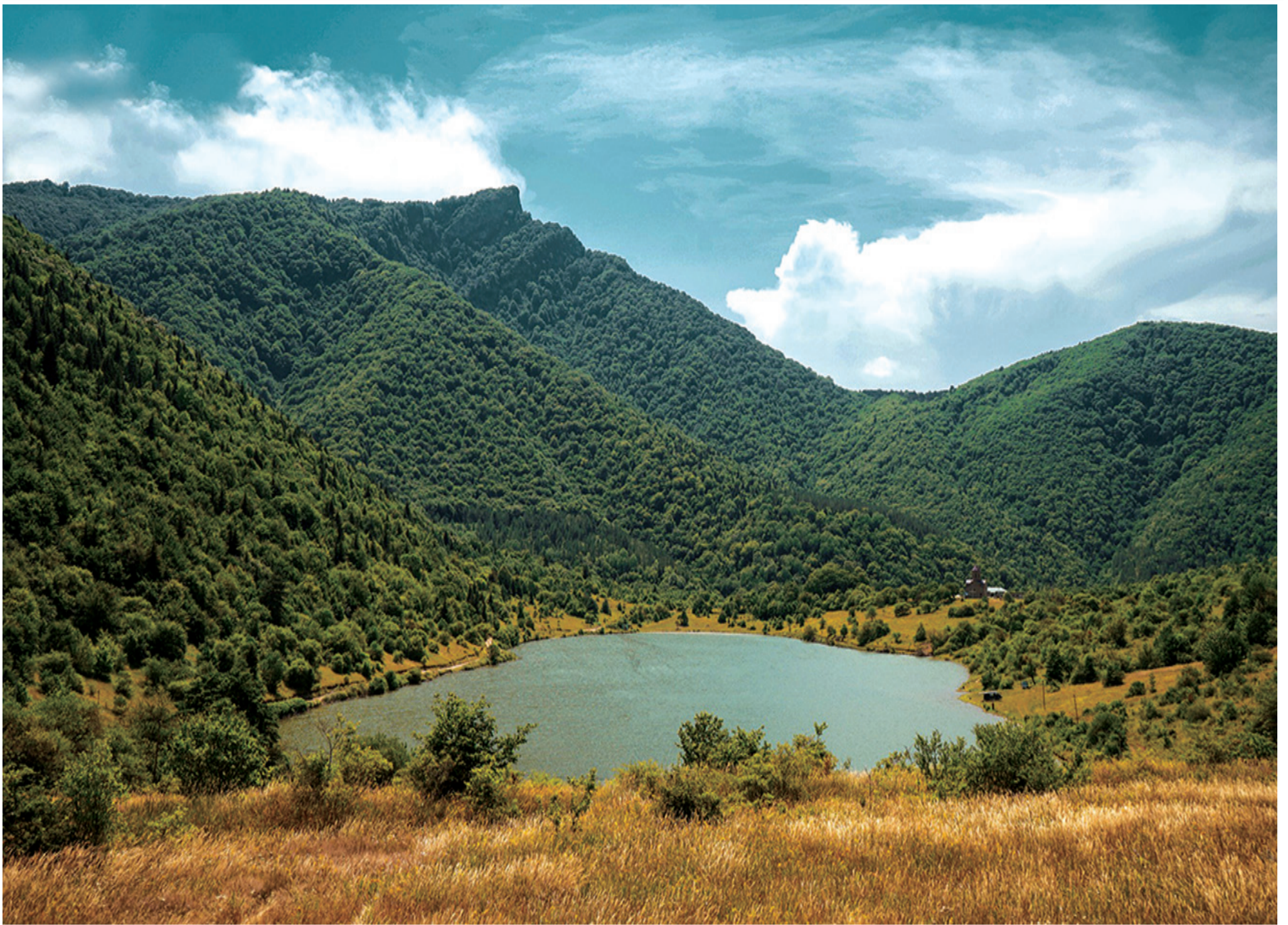
საშურის მუნიციპალიტეტის ტურისტურლი დირსშესანიშნაობები. კოლისწყაროს ტბა.