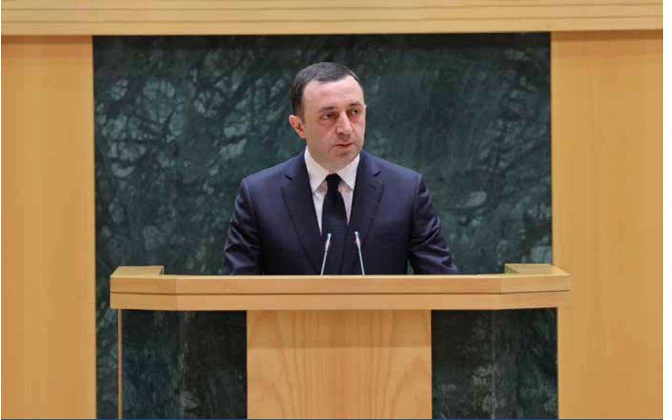
ირაკლი ლარიაშვილი: „ბიუჯეტის გამჭვირვალობის მიხედვით, ჩვენი ქვეყანა პირველ ადგილზეა მსოფლიოში!“

„ზიზის ერთ-ერთი ობიექტი დღეს, აქ, ჩემი კოლეგები და რამდენიმე ჯგუფი გახდა. ლგბტ თემაზე აღარ დასრულდა თქვენი მხრიდან პროპაგანდისტული გზავნილები. ძალიან მიხარია, რომ თქვენი შვილი შეერთებულ შტატებში ისწავლის. იქნებ, მან მაინც შემდეგ აგისნათ, რას ნიშნავს თავისუფალი სამყარო. მე ვნახე, რომ თქვენი შვილი პენსილვანიის უნივერსიტეტში გააგრძელებს სწავლას, მიხარია ნამდვილად და ბევრ ახალგაზრდას ვუსურვებ ამის შესაძლებლობას, დამსახურებულად, ცხადია. იცით, თუ არა, რომ პენსილვანიის უნივერსიტეტი, ამერიკის შეერთებულ შტატებში, ლგბტ საკითხების მიმართ ერთ-ერთი ყველაზე მეგობრულია? ხომ არ გეშინიათ, რომ თქვენს შვილს გადაიბრებენ იქ? ან რამე ზონდირებას მოახდენენ? არ გიფიქრიათ ამაზე?“ – ასე მიმართა პარტია „ლელოს“ წარმომადგენელმა, დეპუტატმა ანა ნაცვლიშვილმა პრემიერ-მინისტრ ირაკლი ლარიაშვილს პარლამენტში და „ნათელი ხაზებიც“ გადაკვეთა. 1 ივლისს, საკანონმდებლო ორგანოში, ირაკლი ლარიაშვილი წლიური ანგარიშით წარსდგა და ვიდრე მისი ვრცელი გამოსვლიდან ძირითად ეკონომიკურ მესიჯებს შემოგთავაზებთ, აუცილებლად უნდა აღვნიშნო, რომ ნებისმიერ პოლიტიკოსს აქვს უფლება, კოლეგა მწვავედ გააკრიტიკოს, შევიდეს მასთან დებატებში, ეკამათოს, ოღონდ არსებობს ნათელი ხაზი – ოპონენტის ოჯახი, განსაკუთრებით, შვილები. არავის არ აქვს უფლება, საკუთარი ოპონენტების შვილებს შეეხოს, არც ოპოზიციას, არც ხელისუფლებას და არც შუამსიტებს!