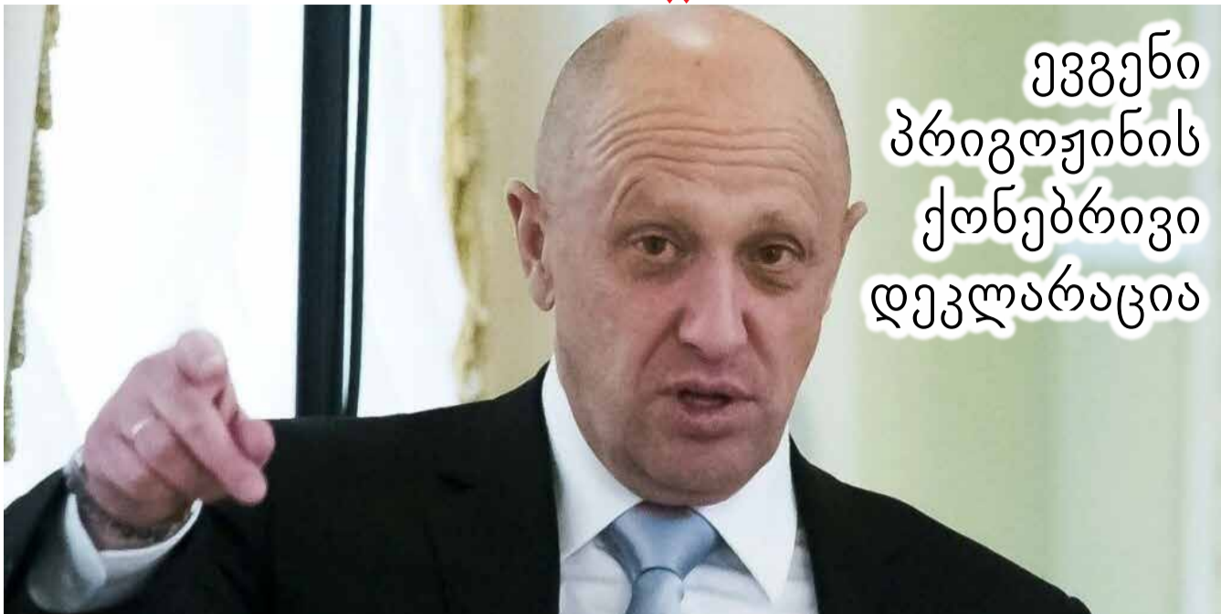
ევგენი პრიგოჟინის ქონებრივი დეკლარაცია

პრიგოჟინი წინ სწრაფად მიიწვედა და ქალაქში პირველი სასურსათო მაღაზიების ქსელ „კონტრასტის“ თანამფლობელი და მმართველი გახდა. ამის შემდეგ, რესტორნების ბიზნესში გადავიდა, რაც მისი კვების ბიზნესის იმპერიის დასაწყისი გახდა. 2001 წლის ზაფხულში, პრეზიდენტის პოსტზე ახლადარჩეულმა პუ-