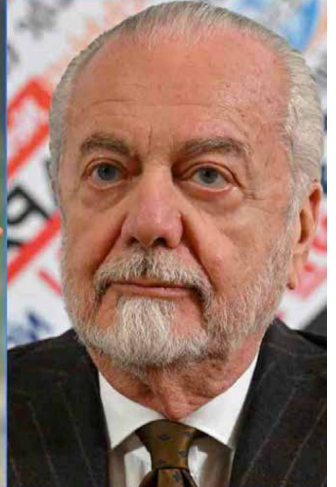
იმის გათვალისწინებით, რომ „ნიუკასლის“ მფლობელი არაბი შეიხია, არ არის გამორიცხული, სურვილის და-