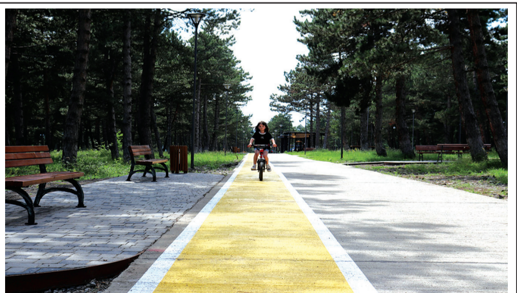
მოედანი. იქნება უამრავი სიახლე, რაც ხაშურელი მოსახლეობისთვის სასიამოვნო იქნება და ისინი რეაბილიტირებულ ტყე-პარკში კომფორტულად დასვენებას შეძლებენ.