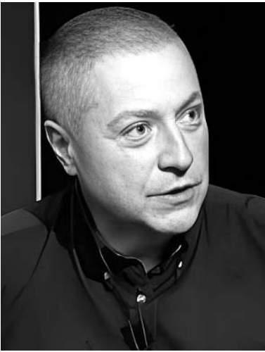
გვესაუბრება პოლიტიკოსი, დიპლომატი, აღმოსავლეთმცოდნე, მეცნიერებათა დოქტორი გიორგი გვახარია:

— თვის ბოლოს ვილნიუსის სამიტზე ვერდიქტი უნდა გამოვიტანო — ვიმსახურებთ თუ არა კანდიდატის სტატუსს. რა მოლოდინები გაქვთ, ქვეყნის შიგნით და გარეთ მართულ პროცესებს როგორ შეაფასებთ?