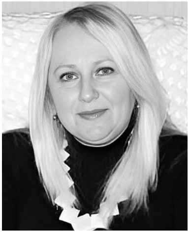
გვესაუბრება საბანკო საქმის ექსპერტი, პროფესორი ლინა მლინაძე: