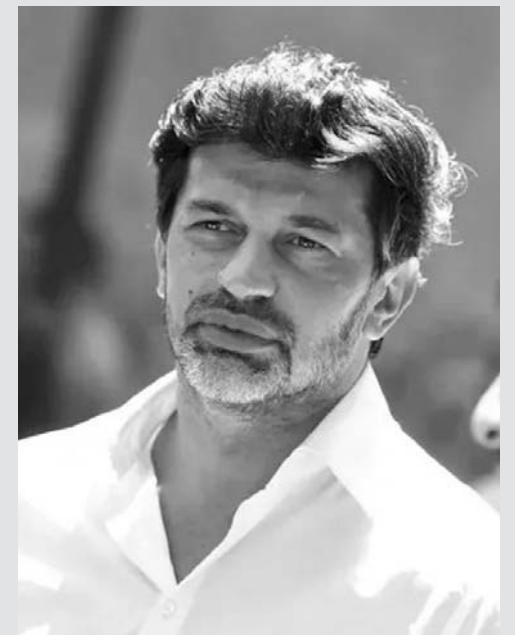
ქაბა ქალაქი: ჩხენი ნებისმიერი თანამშრომელი მზადაა, გამოძიების კითხვებს პასუხი გასცეს

„რა ძალადობის ფაქტებზე საუბრობთ საერთოდ და ძალადობის რომელი ფაქტს ახალიყვებ „ქართული ოცნება?! ძალადობა კატეგორიულად მიუღებელია, ვისი მხრიდანაც არ უნდა იყოს ეს. რაც არ უნდა განსხვავებული აზრის მოსმენა გვიწევდეს, ჩვენ დემოკრატიულ ქვეყანას ვაშენებთ და პასუხი არ უნდა იყოს ძალადობა. არ უნდა ხდებოდეს ძალადობის წახალისება. როდესაც პოლიციელს „მოლოტოვის კოქტილს“ ესვრიან, აქვთ მცდელობა, ცოცხლად დაწვან პოლიციელები, ოპოზიციური სპექტრის წარმომადგენლები კი გამოდიან და სურთ გმირად შერაცხონ ასეთი ადამიანი, ეს დამაზიანებელია“, - აღნიშნა კაბა ქალაქში.