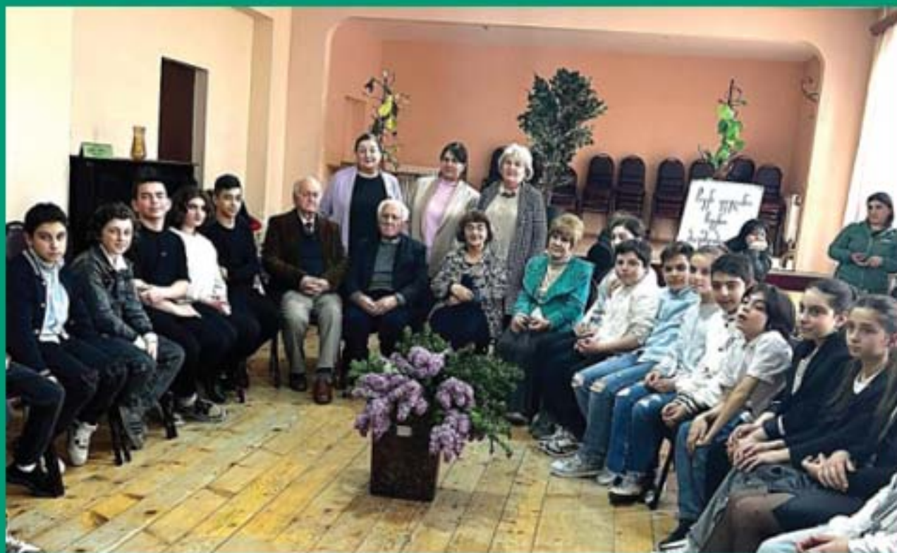
შახვედრა ფარნა რაინასთან თელავის მე-4 საჯარო სკოლაში