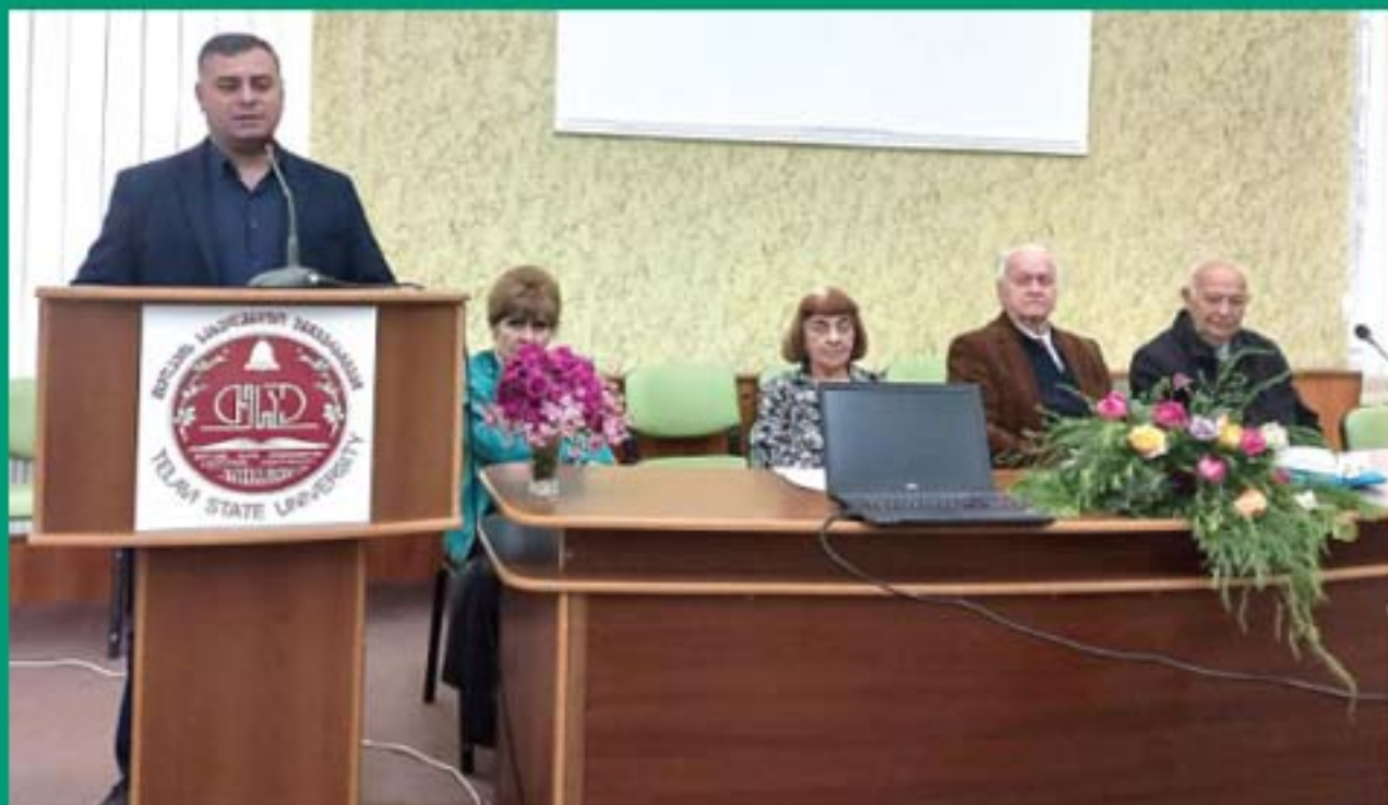
შახვედრა ფარნა რაინასთან თელავის იაკობ გოგვაგავილის სახელობის სახელმწიფო უნივერსიტეტში