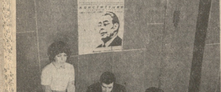
სწავლას უნდა იქნებოდა