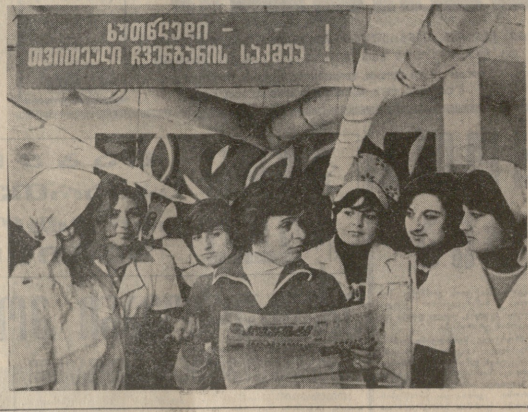
სუბიექტი - თეორიული განხილვის სეპარატი

ყველა ჩვენგანმა, ამხანაგებო, ვხანათ, თუ რა უგოგადებით ინიციატივის, შრომითი და პოლიტიკური აქტიურობის დღიერი მოვალეობა მოახერხებ ახალი კონსტიტუციის განხორციელებას. და სპირიტო, რომ ეს აქტიურობა კი არ ნაღვლაღვდეს. არამედ სხვადასხვა უფრო მითხრავარგოდ, თავიანთი სხვადასხვა სახელმწიფოს საქმეებში მოვალეობითა სულ უფრო ფართოდ მონაწილეობის კონკრეტულ ფორმას იძებნავს.