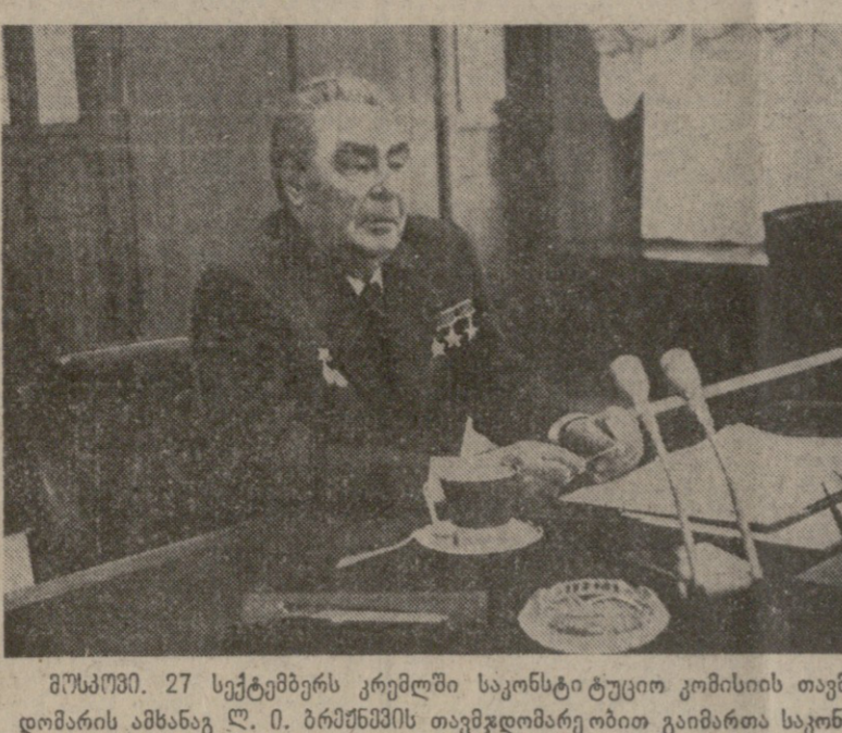
მ. შ. შ. 27 სექტემბერს კრებულ საკონსტიტუციო კომისიის თავმჯდომარის, სკკ ცენტრალური კომიტეტის გენერალური მდიანის, სსრ კავშირის უმაღლესი საბჭოს პრეზიდიუმის თავმჯდომარის ანსანაგ ლ. ი. ბრეტენევის თავმჯდომარეობით გაიმართა საკონსტიტუციო კომისიის მორიგი სხდომა. სურათზე: კომისიის სხდომა.

მზარდი იმპერია — რუსეთის პირველი საბჭოთა სახელმწიფო — გამოართვა საბჭოთა ხალხს რევოლუციური, საბჭოთაო და შრომითი ძალების ადგილებს. საბჭოთაო რევოლუციის გამარჯვებულმა VIII შეიკრება ხალხის გმირების ნორმებისა და პატივისცემის მეშვეობით ცნობებს საბჭოთაო რევოლუციის, ფაქტობრივად რევოლუციის შესახებ, რომელიც საბჭოთა რევოლუციის, საბჭოთა რევოლუციის ექსპონატებისა და საბჭოთა რევოლუციის გახდა. ენთუზიაზმა მეტადიერებით შეიქმნა იმპერია „ოქტობრივი“ ჩვენი სახელმწიფოს ისტორიის რუკაზე.