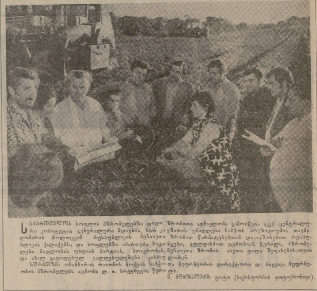
საპარტიო სფეროში მოკრეფილია დიდი შრომით აღმავლობა გამოიწვია სკკ ცენტრალურ კომიტეტის გენერალური მდიანის, სსრ კავშირის უმაღლესი საბჭოს პრეზიდიუმის თავმჯდომარის მოლოცვას რესპუბლიკის მხარეთა შრომით წარმატებულად დაკავრებით, რესპუბლიკის ქალაქებსა და სოფლებში იმართება მტკიცებები, გულდასმით ეცნობიან წარმატებულ მოკრეფეებს და ახალ გადამდგინებულ ვალიდებულებებს კისრულობენ.