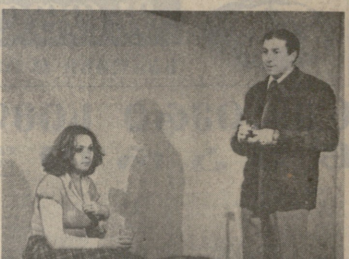
სურათი: სურათი... დღივილი...