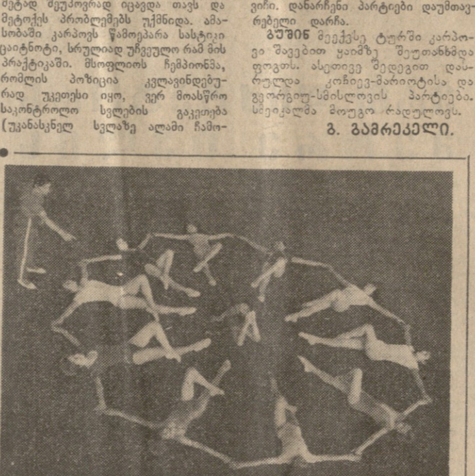
მსოფლიოს ჩემპიონი მთლიან დაპირდაპირად.

სპორტის სპარტაკიადი ბაკვეთილი და მოსწავლეთა უმაღლესი სპორტული ოსტატობის რესპუბლიკური სკოლის (დირექტორი მ. ტუღუშ) მინორიტეტები მუშაობის დასრულებასთან დაკავშირებით მსოფლიო ლარის მხარდაჭერით.