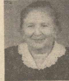
პირველი ქართველი მეტალურგი...