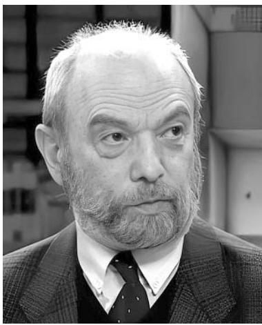
გვესაუბრება პოლიტოლოგი, მეცნიერი კამრამ მამრამიძე: