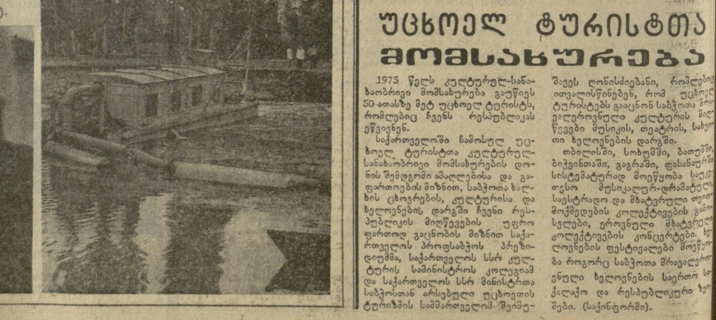
საბავშვო კომპარტიის ცენტრის ფოტო (საქართველოს ფოტოგრაფი).