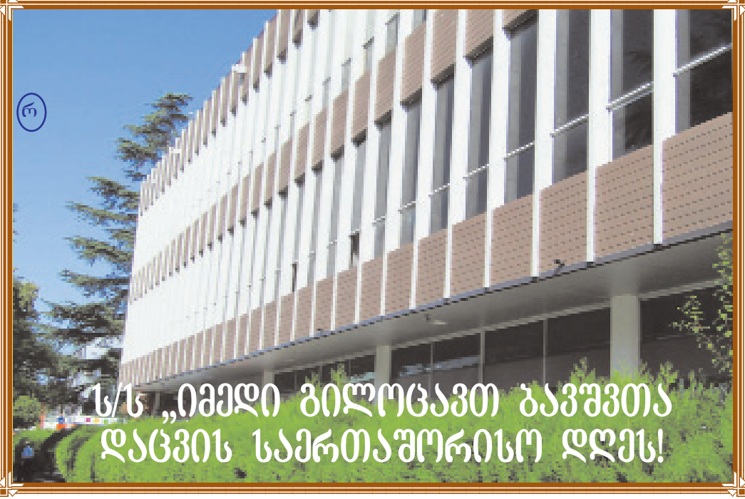
ს/ს „ნიმედი ბილიტადად ბავშვობა და ცვინს სამართაშორისოდ დავუბრუნებ!“