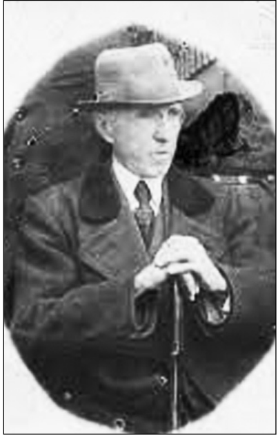
დიმიტრი ერისთავის ქუჩას ადრე გასაბჭოებამდე პროვინციის ქუჩა ერქვა.